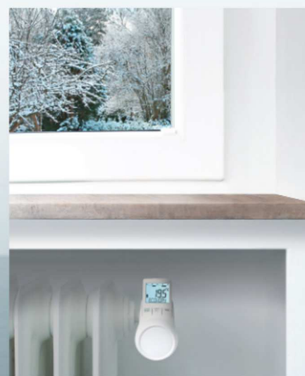
Czytelny nawet w warunkach ograniczonego oświetlenia.